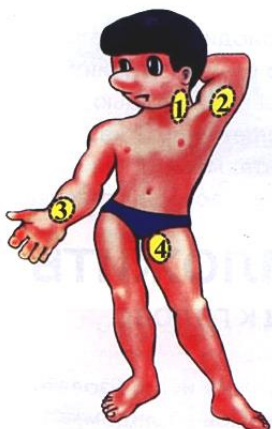
Места прижатия артерий