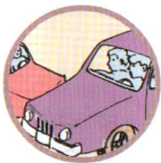
СТОЛКНОВЕНИЕ ТРАНСПОРТНЫХ СРЕДСТВ