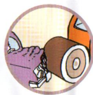
НАЕЗД НА СТОЯЩЕЕ ТРАНСПОРТНОЕ СРЕДСТВО